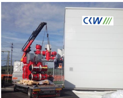
Anlieferung von Teilen der rund fünf Tonnen schweren Schaltanlage

CKW investiert jährlich rund 50 Millionen Franken in Erneuerung und Ausbau ihres Stromnetzes.