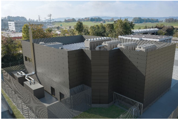
Das neue Datacenter von CKW Fiber Services wird rundum mit Solarpanels bestückt.