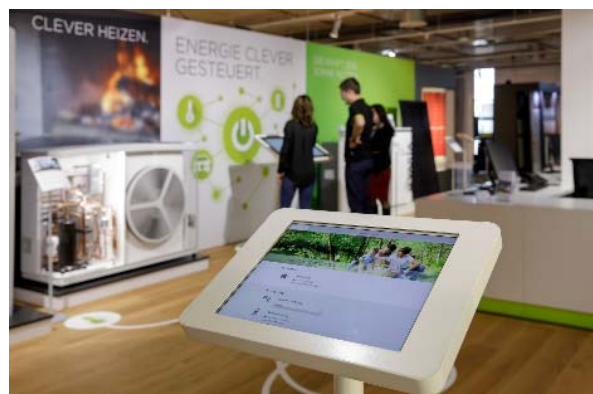
Im neuen Smart Energy Showroom in der Bauarena Volketswil zeigt CKW, wie Solarenergie, Heizung und eMobility intelligent vernetzt werden können.

Bilder in hoher Auflösung unter www.ckw.ch/fotosbauarena